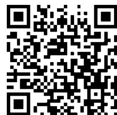
QR Code ADVANCE

Telefone: +55-11-3044-0867 Email: advance@advanceconsulting.com.br Web-site: www.advanceconsulting.com.br